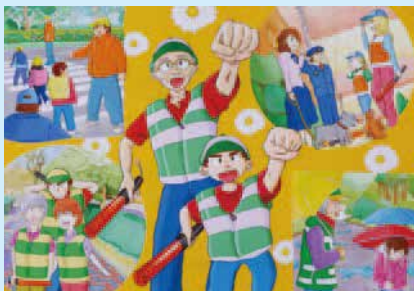
愛知県 伊東 貴志 様