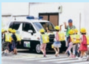
原川 靖宏 様 (66歳 長崎県)