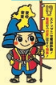
振り込ません兵衛