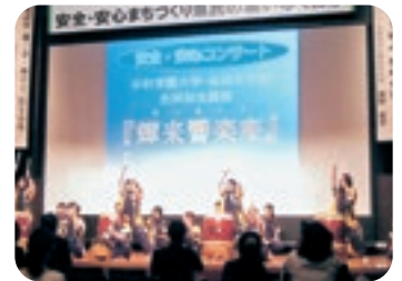
安全・安心コンサート