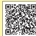
スマートフォンの方

防犯協会、警察では、毎年、県内の全小学校の新一年生を対象に、被害防止ステッカーを配布して、ランドセルに貼るなど、児童に注意を呼びかけています。