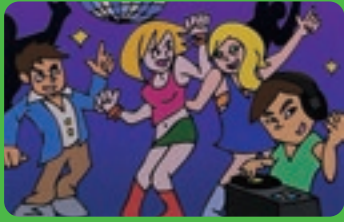
客にダンスをさせる場所を設けるとともに、音楽や照明の演出等を行い、不特定の客にダンスをさせる行為

(※深夜とは、午前0時から午前6時までの時間 ※遊興とは、営業者側の積極的な行為によって客に遊び興じさせること(下記参照))