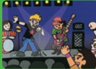
不特定の客に歌手がその場で歌う歌、バンドの生演奏等を聴かせる行為