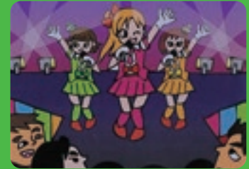
不特定の客にショー、ダンス、演芸その他の興行等を見せる行為