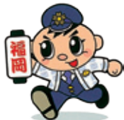
県警シンボル・マスコット「ふっけい君」

110番は緊急電話 相談ごとは#9110 「110番」は、事件・事故などの緊急専用ダイヤルです。相談ごとなどの急を要しない通報は、「#9110」※ダイヤル回線からは、092-641-9110へ電話して下さい。