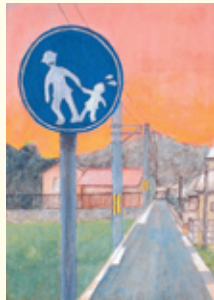
平井 里佳 (古賀竟成館高校)