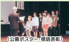
(公募ポスター・標語表彰)