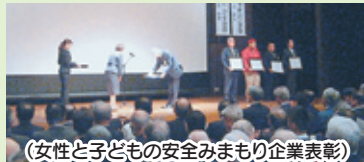
(女性と子どもの安全みまもり企業表彰)