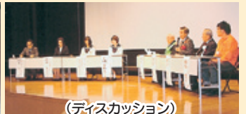
(ディスカッション)