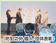
(防犯功労(個人・団体)表彰)

長年、地域防犯活動に尽力し、社会貢献された防犯功労者や防犯功労団体及び全国地域安全運動の公募ポスター・標語の優秀作品に対する表彰のほか、女性と子どもの安全みまもり企業に対する表彰が行われました。 (※表彰受賞者は2～3ページに掲載)